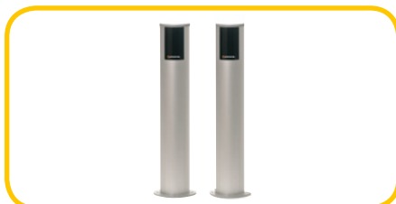
KOLUMNY NA FOTOKOMÓRKI