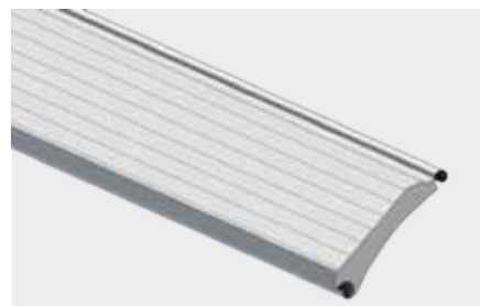
PROFIL STALOWY OCIEPLONY o wysokości krycia 95 mm