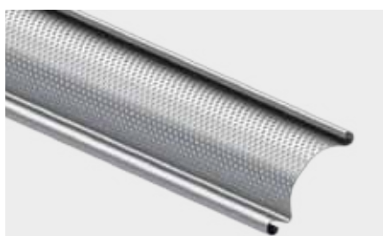
PROFIL ALUMINIOWY LUB STALOWY PERFOROWANY o wysokości krycia 91 mm

Wygląd i budowa krat rolowanych zależą od miejsc, w których się je montuje i funkcji, które pełnią. W pomieszczeniach, które powinny być nie tylko bezpieczne, ale także wyeksponowane sprawdzają się kraty ze stalowych rurek prostych lub giętych sinusoidalnie. Do nowoczesnych wnętrz, wymagających wysokiego poziomu wentylacji doskonale pasują kraty aluminiowe z otworami w kształcie prostokątów. Kraty ze stalowych i aluminiowych perforowanych profili zapewniają jednocześnie przesłonę optyczną i przepuszczalność powietrza na poziomie 28%. Kraty aluminiowe i kraty stalowe zbudowane z profili perforowanych można lakierować na jeden z 200 kolorów palety RAL.