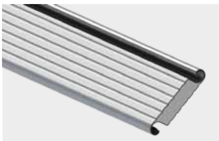
PROFIL ALUMINIOWY OCIEPLONY o wysokości krycia 100 mm

Bramy przemysłowe mają bardzo różne przeznaczenia. Produkujemy je dokładnie według wskazanych wymiarów, stosując rozwiązania dopasowujące urządzenia do różnych zadań i warunków zabudowy. Są to m. in. profile z okienkami oraz profile wentylacyjne, a w bramach zimnych profile perforowane. Ciekawą propozycją jest tzw. „brama z tatuażem”, czyli z indywidualnie zaprojektowaną perforacją pancerza, np. nawiązującą wzorem do prowadzonej w danym obiekcie działalności.