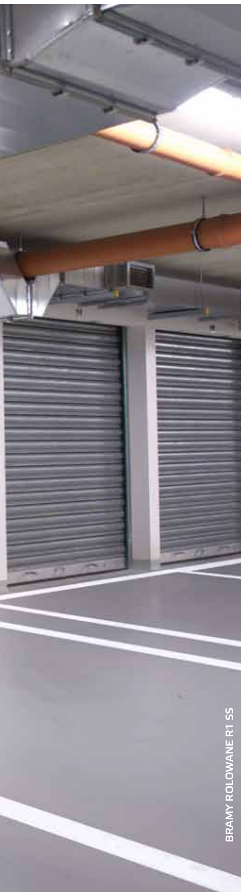
BRAMY ROLOWANE R1 SS

Bramy przemysłowe mają bardzo różne przeznaczenia. Produkujemy je dokładnie według wskazanych wymiarów, stosując rozwiązania dopasowujące urządzenia do różnych zadań i warunków zabudowy. Są to m. in. profile z okienkami oraz profile wentylacyjne, a w bramach zimnych profile perforowane. Ciekawą propozycją jest tzw. „brama z tatuażem”, czyli z indywidualnie zaprojektowaną perforacją pancerza, np. nawiązującą wzorem do prowadzonej w danym obiekcie działalności.