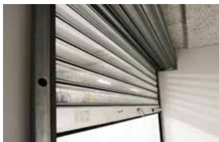
KRATA PERFOROWANA R2 SP