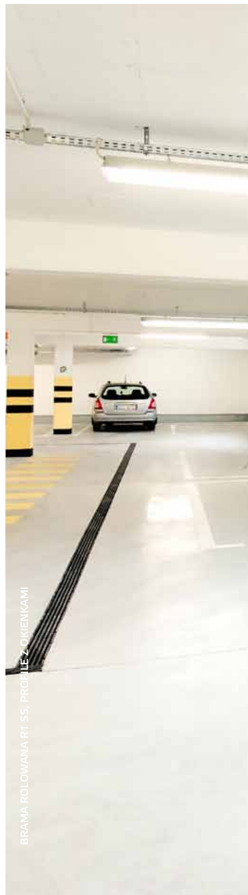
BRAMA ROLOWANA R1 S5, PROFILE Z OKIENKAMI