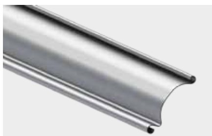
PROFIL ALUMINIOWY JEDNOŚCIENNY o wysokości krycia 91 mm