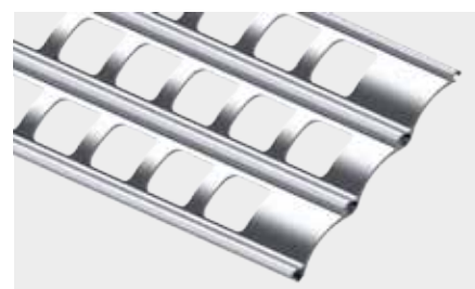
PROFIL ALUMINIOWY SZTANCOWANY o wysokości krycia 60 lub 85 mm