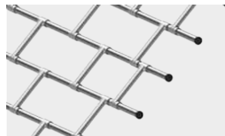
RURKA STALOWA PROSTA POŁĄCZONA POPRZECZKAMI o wysokości krycia 120 mm