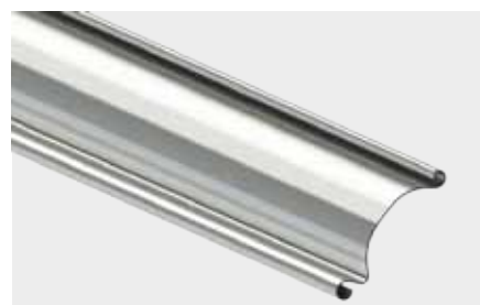
PROFIL STALOWY JEDNOŚCIENNY o wysokości krycia 91 mm