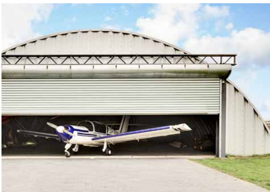
BRAMA R1 SS Z JEDNOŚCIENNYCH PROFILI STALOWYCH

Ze względu na swoją wytrzymałość umożliwia tworzenie bardzo szerokich konstrukcji